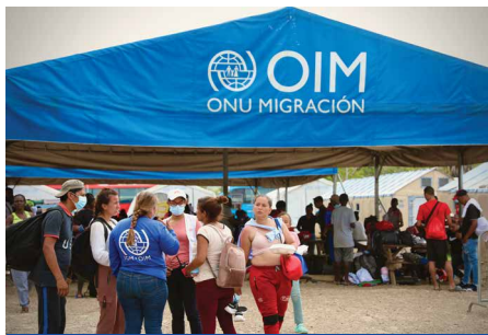
GESTIÓN Y COORDINACIÓN DEL CAMPAMENTO

Herramienta analítica y operacional para identificar el apoyo de la Organización a los Estados Miembros y sus socios con el fin de mejorar la preparación, respuesta y recuperación en situaciones de crisis migratoria. En 2020 se creó el Grupo de Movilidad Humana (GMH) del Sistema de las Naciones Unidas, co-liderado por el ACNUR y la OIM, por el aumento de los movimientos mixtos entrantes de personas migrantes y personas necesitadas de protección al territorio panameño y la importancia de garantizar el respeto a sus derechos humanos y la convivencia pacífica, así como para brindar acompañamiento al Estado panameño en el cuidado y tratamiento de esta población. En 2018, se estableció en la Ciudad de Panamá la Plataforma Regional de Coordinación Interagencial para Refugiados y Migrantes de Venezuela (R4V) , la cual también es co-liderada por ACNUR y OIM, y coordina los esfuerzos de casi 200 organizaciones bajo el Plan de Respuesta a Refugiados y Migrantes (RMRP) de Venezuela en 17 países de América Latina y el Caribe.