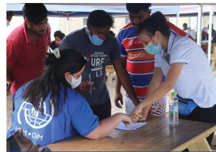
SEGUIMIENTO DE LOS DESPLAZAMIENTOS

La OIM lidera el Grupo Temático Mundial de Gestión y Coordinación de Campamentos (CCCM por su sigla en inglés). En este contexto, se aplican enfoques innovadores para la gestión de las personas desplazadas mediante asociaciones estratégicas con organismos de las Naciones Unidas, autoridades nacionales, el sector privado y ONG. La OIM proporciona orientación e información a las personas migrantes en condiciones de vulnerabilidad en las Estaciones Temporales de Recepción Migratoria (ETRM), así como gestión de casos y derivaciones. Además, la OIM brinda asistencia técnica al Gobierno de Panamá en el desarrollo de protocolos para el funcionamiento interno de las ETRM.