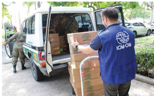
MARCO OPERACIONAL DE LA OIM EN SITUACIONES DE CRISIS

Herramienta analítica y operacional para identificar el apoyo de la Organización a los Estados Miembros y sus socios con el fin de mejorar la preparación, respuesta y recuperación en situaciones de crisis migratoria. En 2020 se creó el Grupo de Movilidad Humana (GMH) del Sistema de las Naciones Unidas, co-liderado por el ACNUR y la OIM, por el aumento de los movimientos mixtos entrantes de personas migrantes y personas necesitadas de protección al territorio panameño y la importancia de garantizar el respeto a sus derechos humanos y la convivencia pacífica, así como para brindar acompañamiento al Estado panameño en el cuidado y tratamiento de esta población. En 2018, se estableció en la Ciudad de Panamá la Plataforma Regional de Coordinación Interagencial para Refugiados y Migrantes de Venezuela (R4V) , la cual también es co-liderada por ACNUR y OIM, y coordina los esfuerzos de casi 200 organizaciones bajo el Plan de Respuesta a Refugiados y Migrantes (RMRP) de Venezuela en 17 países de América Latina y el Caribe.